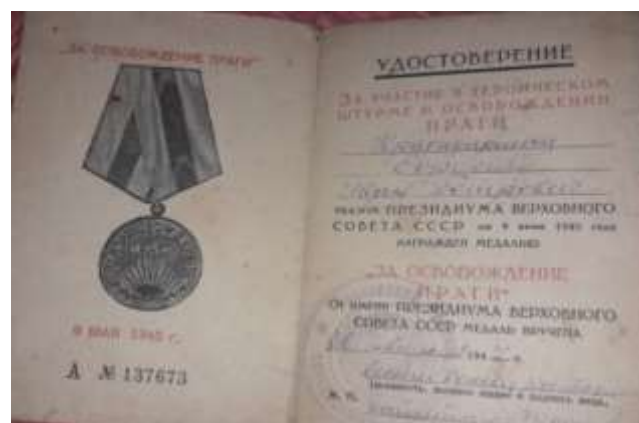
6. Благодарности и награды прадедушки.