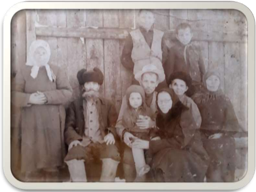
3. Мой прадед со своими родителями после войны.