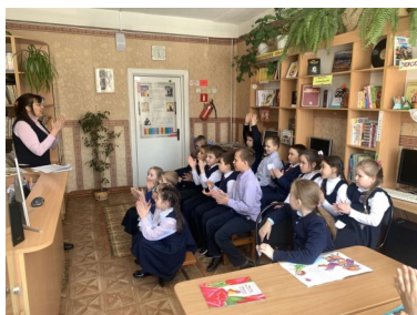
Творческий час в школьной библиотеке «В гостях у Корнея Чуковского»