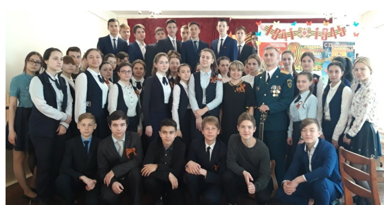
Единые уроки Победы