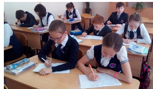
Тотальное сочинение «Чебоксары – город твоих побед!»