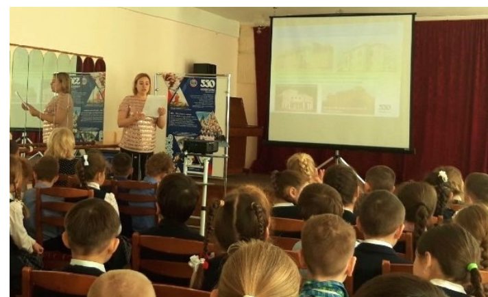
Урок патриотизма «Чебоксары—город твоих побед»