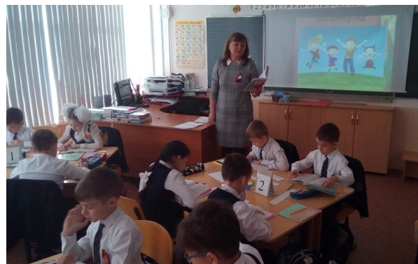
Фестиваль методических идей «Современный учитель: профессионализм и педагогическое творчество»