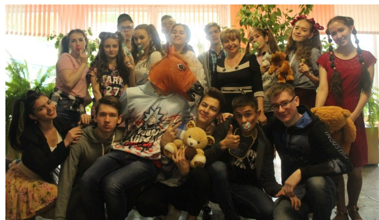
Традиционный праздник для выпускников «День Детства»