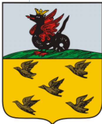
Герб города Чебоксары образца 1781 года