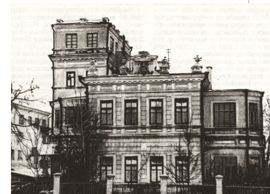
Дом купца Н.П. Ефремова,

города». Своим высочайшим указом в 1781 году императрица утвердила герб Чебоксары и первую карту города. Исторический герб, пожалованный городу Екатериной Великой: «Пять летящих в золотом поле уток...». Этот неповторимый символ в мировой геральдике означает стремление к свободе, инициативе и достижению поставленных целей.