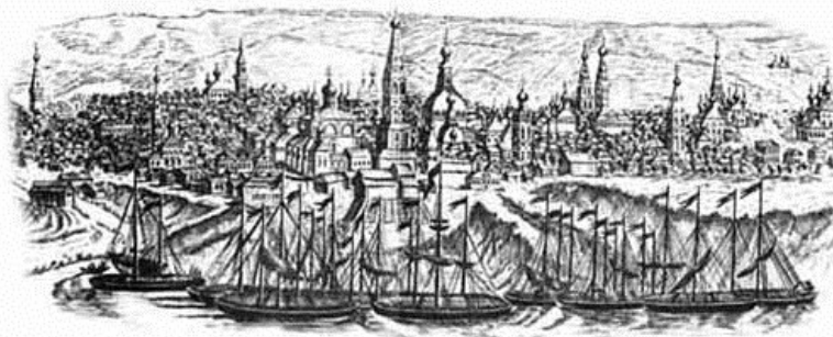
Вид города Чебоксары с Волги