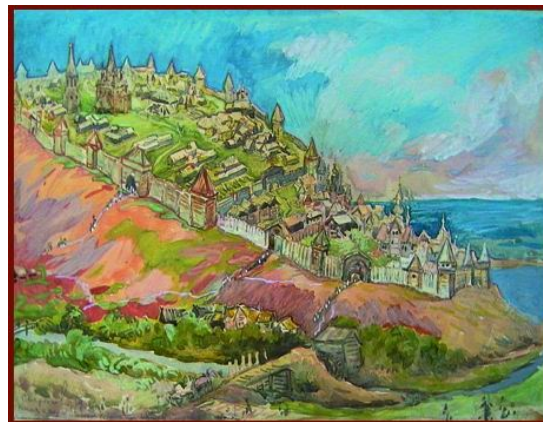
Н.К. Свирчков Чебоксарский кремль при Иване Грозном 19 века 1978. Б., гуашь.