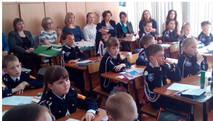
Обучающиеся читают стихи,

Тотальный диктант по чувашскому языку «Пётём чăваш диктанчĕ – 2019»,